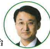
鳥取県知事 平井 伸治

鳥取県では、平成25年10月に「鳥取県手話言語条例」を制定し、全国でも手話の普及を進める先導役を果たしています。鳥取県内では、この条例制定をきっかけに手話への関心が高まり、手話学習を始める方がどんどん増えてきています。