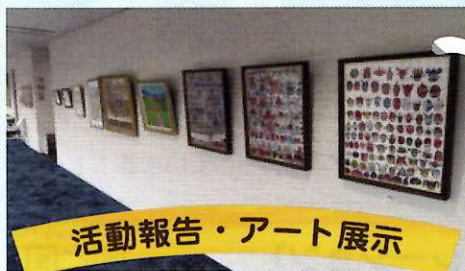
活動報告・アート展示