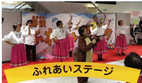
ふれあいステージ

要約筆記や手話、最新の支援機器など、さまざまな障がいに関する体験ができるコーナー多数